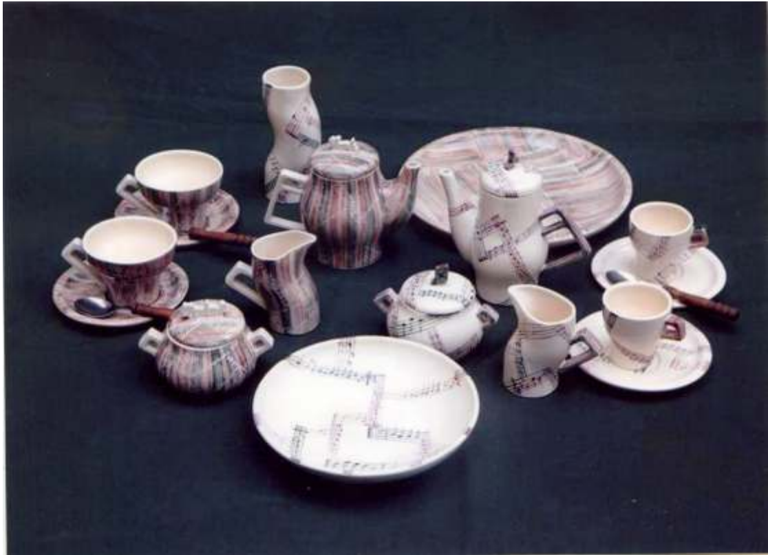
Новицька А.В., «Музика», 2015 р. (фаянс, емалі).