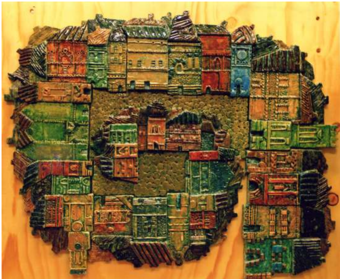
Панчишин Л. О., декоративний рельєф «Архітектурна хвиля», 2012, керівник: Левків Т.Б., (шамотна маса, підполив`яні фарби)