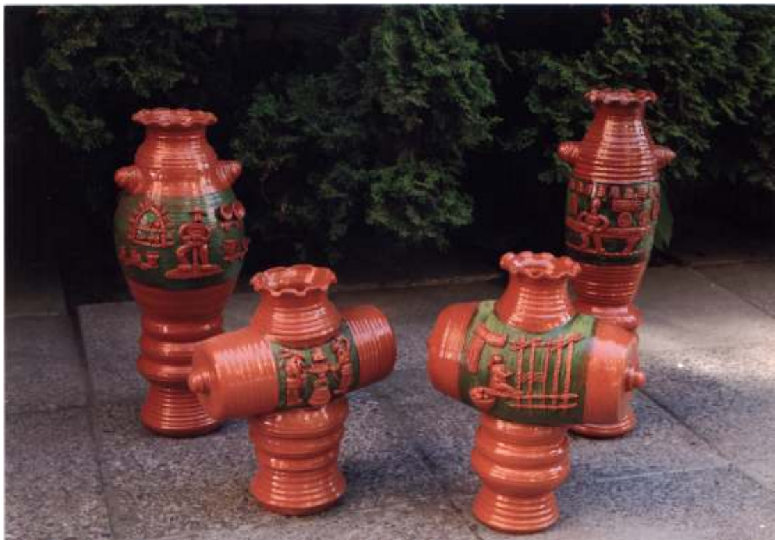
Шпак О.Я., декоративні вази «ремесла», м. Жовкви, 2011, керівник Гураль О.Ф.