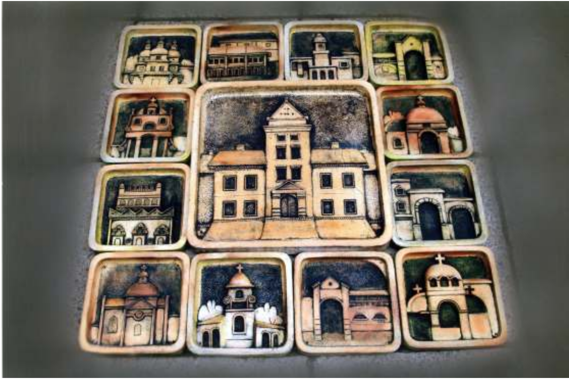
Калічак Ю. Т., декоративна композиція для заповідника м. Жовкви, 13 частин, шамотна маса, солі, поливи; керівник: Левків Т.Б., 2011