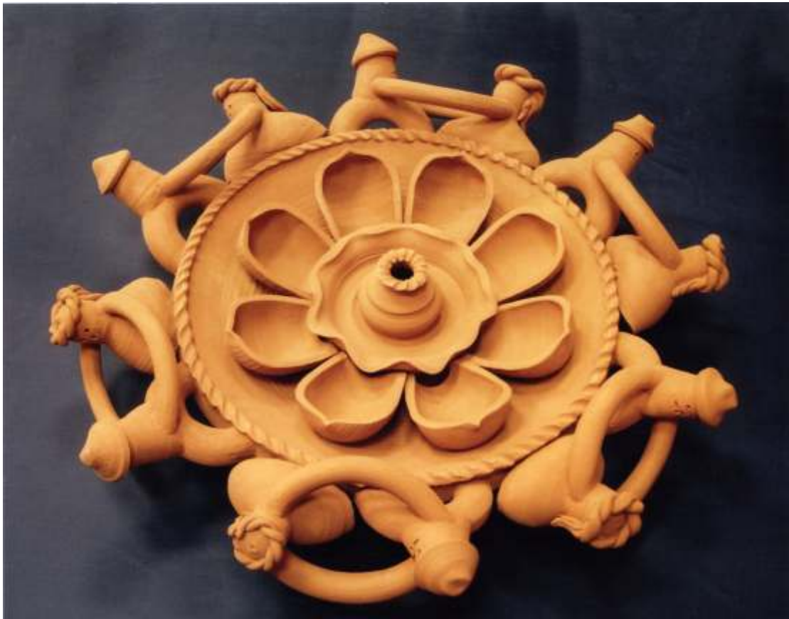
Ярема Н.В., декоративна композиція «Українські народні танці», 1 частина, 3 частини 2012р. керівник: Левків Т.Б., глина, гончарний круг