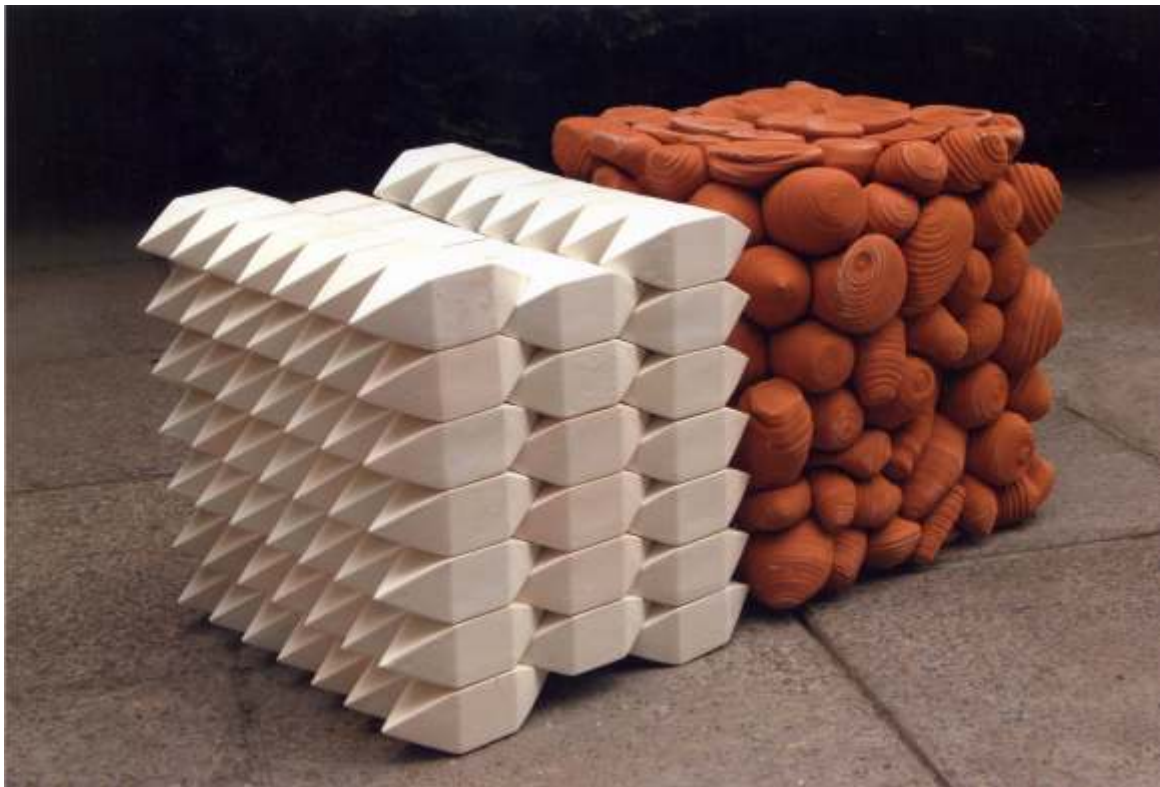
Євтушенко Є.В., декоративна композиція «Хаос і Логос», 2007, кількість частин - 2 (гончарна маса, фаянс, емалі) 48x48x48, керівник Левків Т.Б.